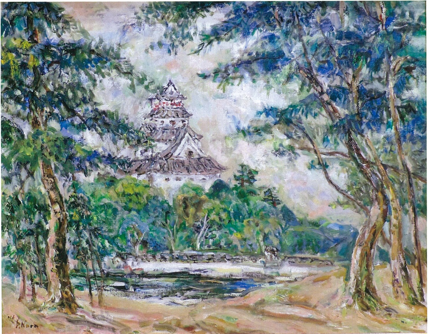
「松と城 <唐津追想>」 2016年