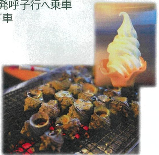
※ふるまいは変更する場合があります。