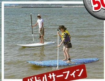
パドルサーフィン