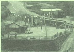
蕨野棚田交流広場