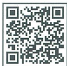
QRコードからチケットを購入