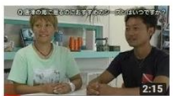
唐津マリンスポーツクラブ