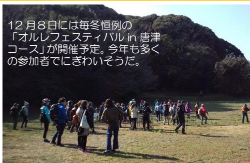
12月8日には毎冬恒例の「オルレフェスティバル in 唐津コース」が開催予定。今年も多くの参加者でにぎわいそうだ。