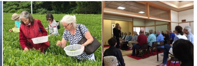
5月のロストラル入港時に開催された乗船客向けツアー。近松寺での講話(右)、北波多での茶摘み(左)などの体験を楽しんだ。

近年、唐津の観光振興を担う大きな要素となりつつあるクルーズ船の入港。今後も唐津港における国内外クルーズ船の入港数は、順調な増加が見込まれています。