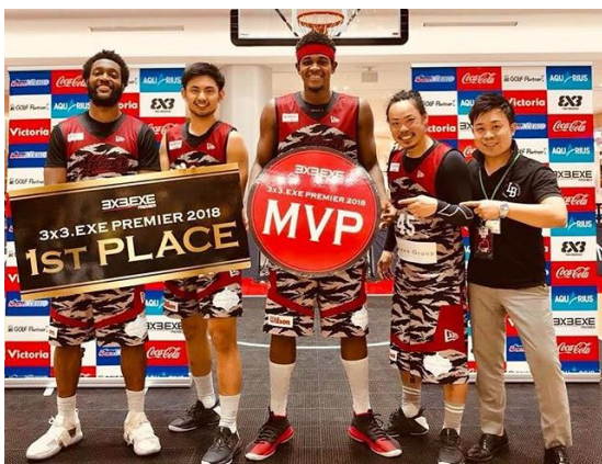
中央がジェyson・カーター選手。リーグ総合ダンク王に加えて、九州・沖縄地区では得点、リバウンド、アシストの3冠王を獲得した3×3のトップスターだ。

また、個人の総合成績においてもジェyson・カーター選手がダンクシュート部門でぶっちぎりの全国NO.1に！ この勢いでファンを増やし、唐津を3×3の聖地にしてほしいものです。