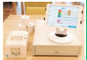
Airレジの周辺機器の例。利用にはネット環境が必要。問/からつ観光協議会 エアレジサポート係 ☎ 0955-72-3278