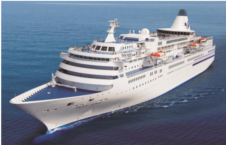
ばしふいっくびいなす