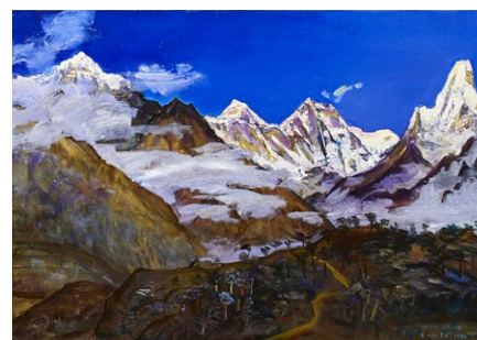
「エベレストへの道(シャンボジェにて)」(91.0cm×65.2cm)