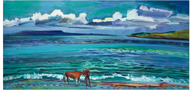
「チャニザサの海」(50号変型)