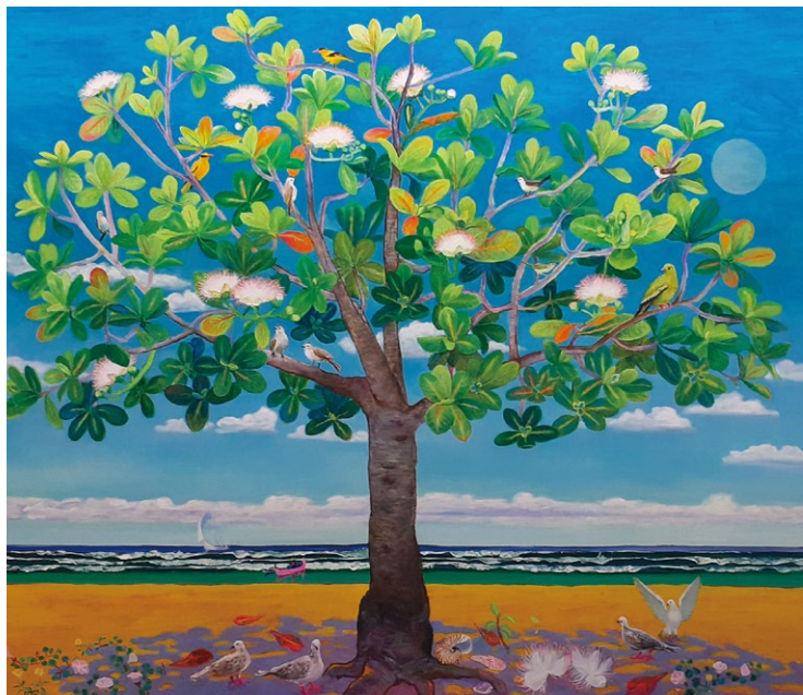
「平和の木〜ウクライナに寄せて」(2022年、150号)