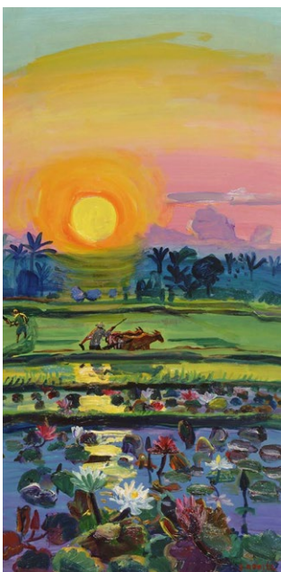
「耕至天耕して天に至る」(25号変型)