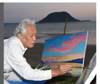
唐津・西の浜にて(2021年)