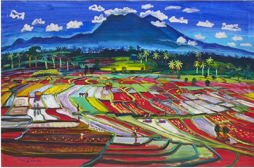
「ソリタガンガの棚田」(40号変形)